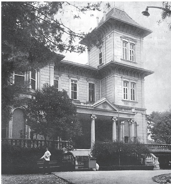
Rees Ailesi Köşkü, Buca.