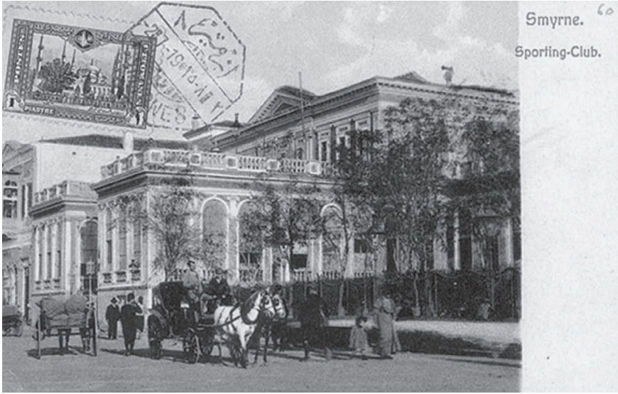
Levantenlerin İzmir'deki meşhur kulüplerinden Sporting Club.

bar gibi işletmelerde ve kendi mülklerinde düzenledikleri danslı-müzikli etkinliklerde sık sık bir araya gelmiş, inşa ettikleri Apollo adlı açık hava tiyatrosunda pek çok oyunun kalabalık izleyicilerle buluşmasını sağlamışlardır. Levantenlerin büyük önem verdikleri meşgalelerden biri de spordur. Daha 20. yüzyıla gelinmeden, kurdukları irili ufaklı birçok spor kulübü İzmir genelinde boy göstermeye ve kendi aralarında turnuvalar düzenlemeye başlamıştır. Futbol, tenis, basketbol, bisiklet ve golfle ilgilenen Levantenler, at yarışlarının organizasyonu için de bir kulüp kurmuş, uygulanması içinse Buca Hipodromu'nu inşa etmişlerdir. Bu etkinlikleri uzunca bir süre sadece kendi topluluklarına yönelik olarak düzenlerler.