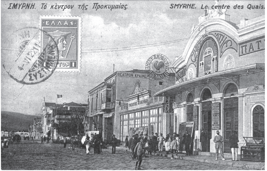
19. yüzyılda İzmir rıhtımını gösteren bir kartpostal.

ri düzenleyenlerse, bölgeye yerleşen Avrupalı soylu ailelerin üyeleridir. Seyyahların notları ve 19. yüzyıl kartpostallarında görünen malikâne fotoğrafları, Levantenlerin servetleri, eğitim ve kültür düzeyleri, zevk ve estetik anlayışları hakkında fikir edinmek için yeterli belgelerdir. Kolonyal üslupta yüksek duvarlarla çevrilmiş ve hayli ihtişamlı görünen bu köşk ve malikânelerin sadece birkaçı bugün kullanılmaya devam ediyor. Bir kısmı ayakta olsa da işlevsiz, büyük bölümü ise yıkılmış halde. Levanten ailelerin kültürel ve sanatsal birikimlerini günümüze taşıyan belki de en çarpıcı örnekse, görkemli All Saint Church Kilisesi ile bugün hâlâ bahçesinde yatan ve her biri adeta birer heykeltıraş eseri olan mezar taşlarıdır.