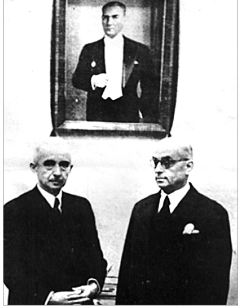
Cumhurbaşkanı İsmet İnönü ve Bařbakan Celal Bayar (11 Kasım 1938)

DP'nin iktidara geliři ile birlikte gerçekte ise her ikisi de önemli siyasî ađırlıklara sahip Cumhurbaşkanı ve Bařbakan arasındaki güç dengesinin görelî deđiřimidir. Bu uygulama, sadece DP iktidarı ile de sınırlı kalmayacak; siyasetin bařbakanlar eliyle belirlenmesi ve parti TBMM grubu üzerindeki hâkimiyetin yine onlar ve çevreleri aracılıđıyla tesis edilmeleri günümüze kadar devam edecektir. Bu, o kadar belirgin bir dönüřümdür ki, bařbakanların siyasal yapının başat gücü olmaları durumu, darbelerin ardından Cumhurbaşkanlıđı makamını iřgal eden muktedir emekli askerler döneminde dahi deđiřmeyecektir.