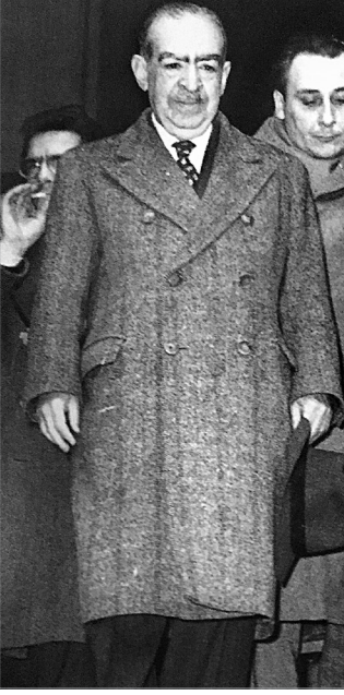
Hakkında birçok dava açılan gazeteci Ahmet Emin Yalman, bir duruşma sonrası adliyeden çıkarken.

tine dokunacak neşriyattan, dolayı İcra Vekilleri Heyeti kararile” gazetelerin kapatılabileceğine hükmetmektedir.